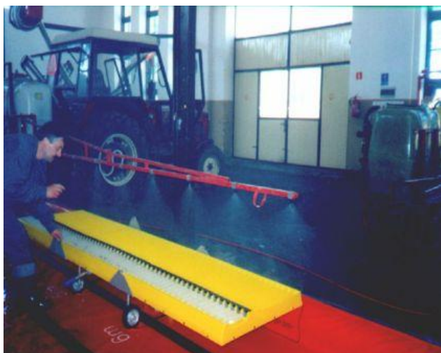
Fot. 4. Budynek warsztatowy z bramą wjazdową do Stacji Kontroli Opryskiwaczy

W 2004 r. Starostwo sprzedało budynek warsztatowy, w którym znajdowała się Stacja Kontroli Opryskiwaczy z pracownią techniki ochrony roślin, a następnie oddało w dzierżawę gospodarstwo szkolne.