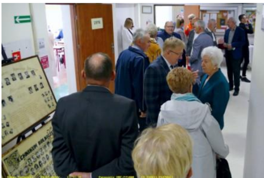
Fot. 21. Korytarze szkolne w drugim dniu Zjazdu