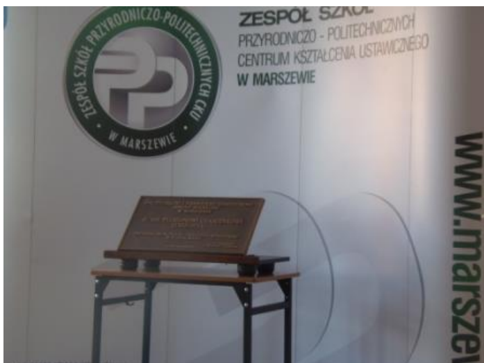
Fot. 7 i 8. Absolwenci Władysław Balcerzak, Roman Malmur i główny sponsor Tadeusz Rak przekazują tablicę społeczności szkolnej.