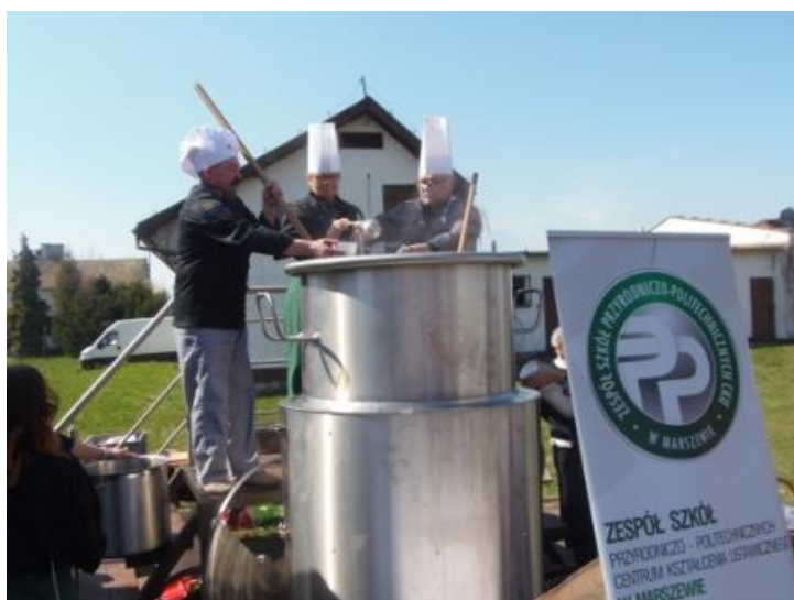
Fot. 9. Żurek przygotowany do degustacji