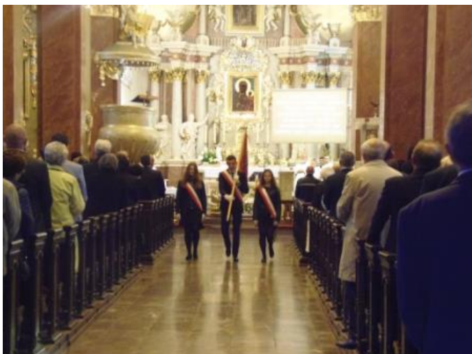
Fot. 11. Poczet sztandarowy po zakończonej Mszy św.

w czterech etapach: Msza święta w kościele parafialnym, akademie jubileuszowa w auli szkolnej, spotkanie w klasach z nauczycielami i wychowawcami, bal w restauracji „Baks”.