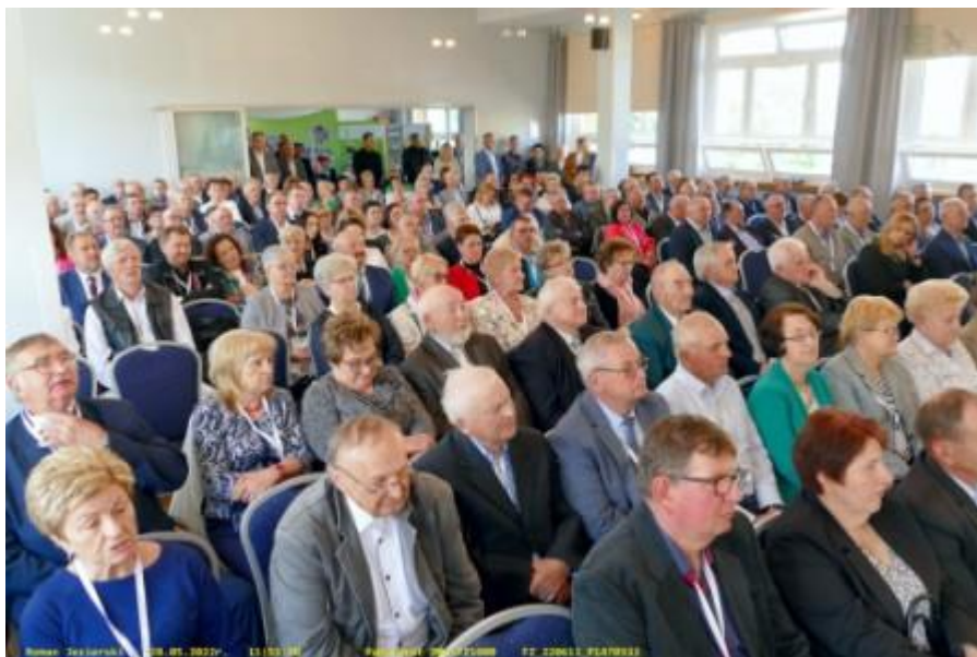
Fot. 20. Aula szkolna w drugim dniu Zjazdu