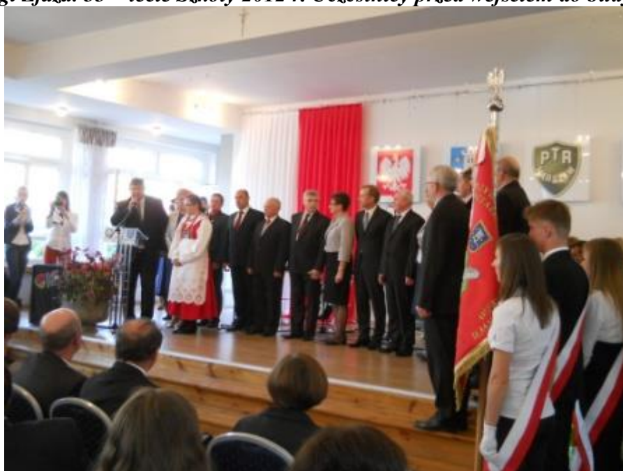
Fot. 3. Podczas uroczystej akademii poseł Piotr Walkowski wręcza odznaki honorowe „ZASŁUŻONY DLA ROLNICTWA” nadane przez Ministra Rolnictwa i Rozwoju Wsi.