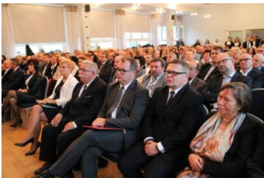
Fot. 12. Jubileuszowa Akademia w auli szkolnej