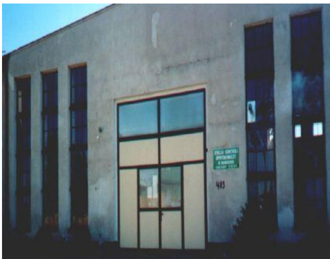
Fot. 5. Badanie techniczne opryskiwacza polowego

W dyspozycji Szkoły pozostało 36 ha gruntów ornych i doświadczalna część budynków gospodarskich. Podjęte decyzje znacząco obniżyły potencjał dydaktyczny kształcenia praktycznego. Presja Starosty Pleszewskiego narastała po wizycie przedstawiciela Ministerstwa Rolnictwa z ofertą przejęcia Marszewskiej Szkoły do sieci szkół ministerialnych, a polegała na przedstawianiu różnych scenariuszy związanych z dalszym funkcjonowaniem Szkoły.