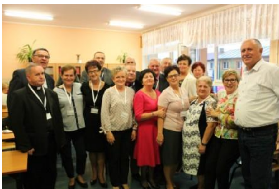
Fot. 13. Spotkania w klasach