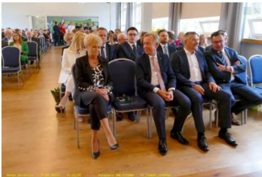
Fot. 18. Aula szkolna w pierwszym dniu Zjazdu

Natomiast sobota 28 maja była poświęcona dla Absolwentów, którzy zwiedzali szkołę, zatrzymywali się w klasach, zasiadali w ławach szkolnych, wzruszali się i wspominali. Na korytarzach szkolnych zrobiło się gwarno jak za dawnych lat. Zjazd zakończył się piknikiem tanecznym.