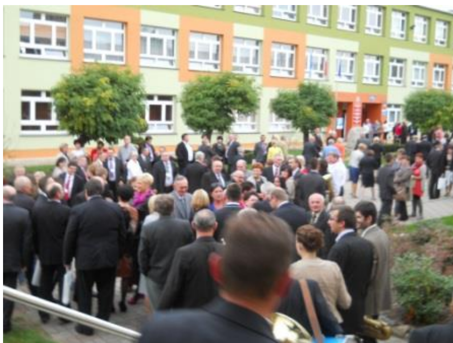
Fot. 2. Drugi Zjazd. 55 – lecie Szkoły 2012 r. Uczestnicy przed wejściem do budynku głównego.

Ustalono termin uroczystości na 29 września 2012 r. i do tego czasu nasza działalność była skupiona na przygotowaniach do obchodów Jubileuszu.