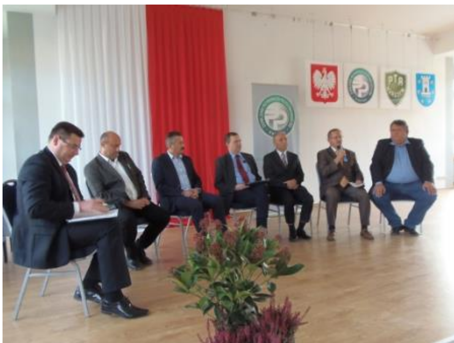
Fot. 6. Panel dyskusyjny podczas konferencji